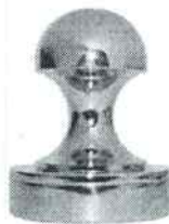
Рис. 1. Образец ручки для металлического шкафа

Примечание. Учитывается вид финишной отделки и дизайн готового изделия.