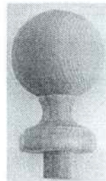
Рис. 1. Образец мебельной ручки для шкафа